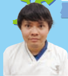
金市 出身地：宮崎県

宮崎の名物と言えばチキン南蛮! 宮崎地鶏! おいしい鳥がいっぱいです! 青島のきれいな海もあり、モアイ像があるサンメッセ日南があります。サンメッセ日南ではモアイによって金運、恋愛運などが分かれています!! 是非、お望みのモアイと一緒に写真を撮りに行ってみたいかがでしょうか? いっぺん宮崎に来てみらんね!!